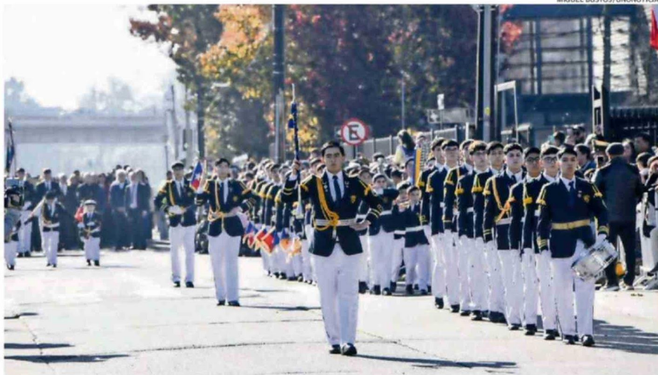
LA BANDA DE HONOR DEL INSTITUTO SALESIANO MARCÓ EL DESFILE DE LA COMUNIDAD EDUCATIVA DURANTE SU PARTICIPACIÓN EN LA CEREMONIA.

Posteriormente se desarrolló el esquinazo realizado por el Conjunto Folclórico "Surcama-