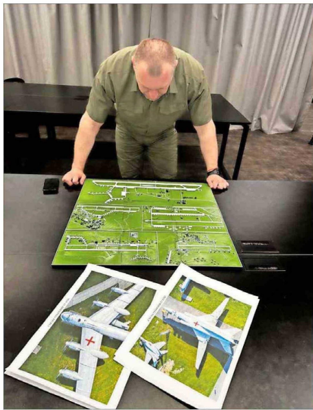
EL JEFE del Servicio de Seguridad de Ucrania, Vasyl Malyuk, mira un mapa que muestra una base aérea militar rusa.

El Ministerio de Defensa ruso afirmó que drones ucranianos atacaron aeródromos en cinco regiones y que varios aviones fueron incendiados.