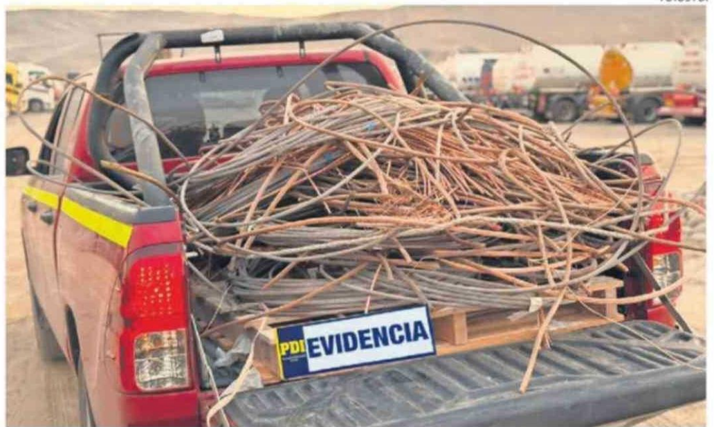
PARTE DEL MATERIAL INCUATADO EN ESTE OPERATIVO.

A través del trabajo investigativo se logró ubicar el vehículo, y se constató que, bajo una carga de juguetes y ropa usada, se ocultaba una