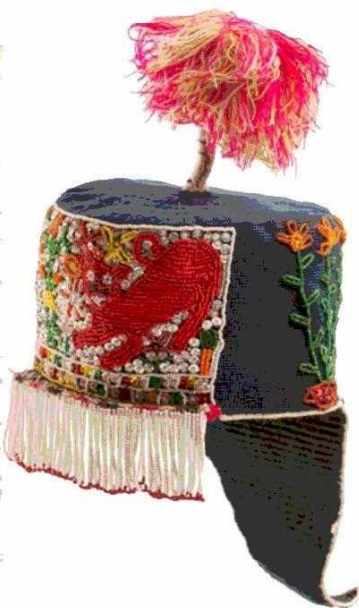
Gorro hecho por mujeres bolivianas de Tarabuco. Lo usan las solteras.