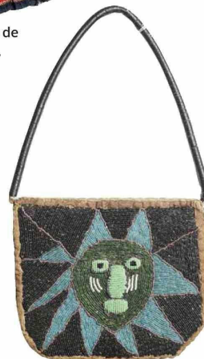
Contenedor usado por los yoruba, Nigeria, para llevar elementos de adivinación.