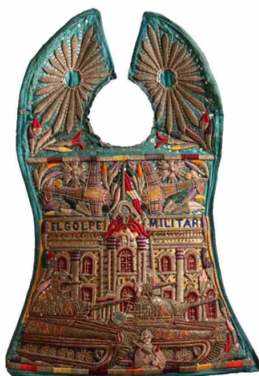
Esclavina realizada para conmemorar el golpe de Estado peruano, 1968. Las hacen los hombres.