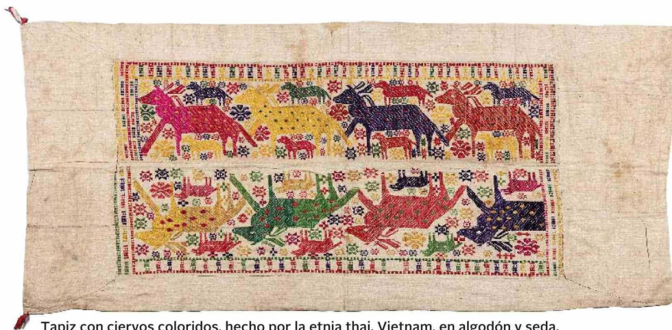
Tapiz con ciervos coloridos, hecho por la etnia thai, Vietnam, en algodón y seda.