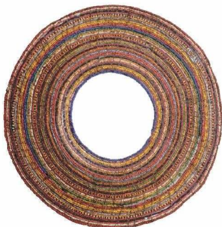
Collar de cuentas de la etnia masái, Kenia.