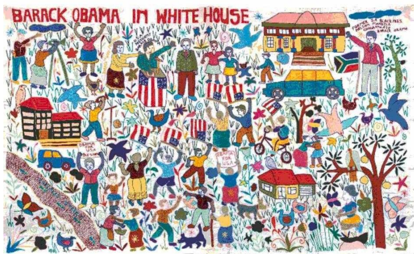
Bandera que celebra la presidencia de Obama. Hecha por el colectivo textil Mapula, Sudáfrica.

Tiraje: 126.654 Lectoría: 320.543 Favorabilidad: No Definida