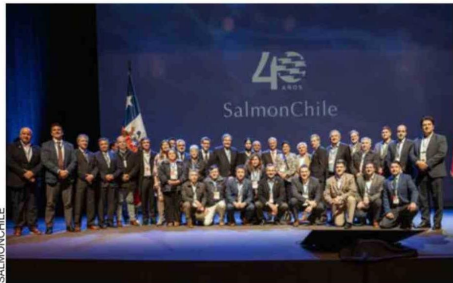
El foro, realizado en el Teatro del Lago en Frutillar, reunió a representantes de la salmonicultura, autoridades, empresariado y el mundo académico, con el fin de abordar los desafíos y oportunidades que enfrenta la actividad acuícola nacional.