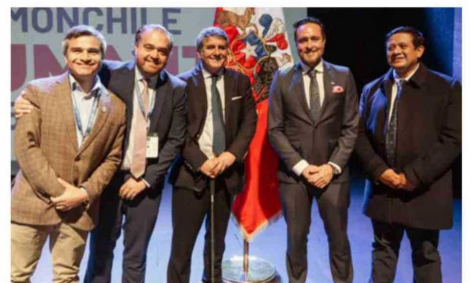
Marcelo Santana, gobernador regional de Aysén; Sergio Giacaman, gobernador regional del Biobío; Alejandro Santana, gobernador regional de Los Lagos; Rodrigo Wainraihgt, alcalde de Puerto Montt, y Marco Silva, alcalde de Calbuco.