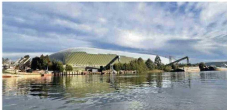
SE CAMUFLA EN EL ENTORNO PARA NO INTERRUMPIR EL PAISAJE.

de soluciones visuales, la docente transformó esta gran infraestructura en un elemento que se integra armónicamente al ecosistema