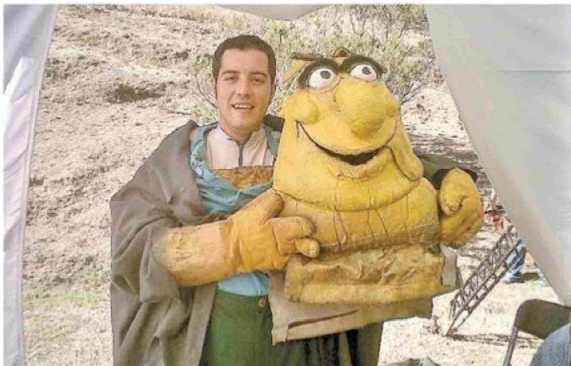
Entre los trabajos que Rodrigo desarrolló en Chile fue reemplazar a personajes de Cachureos. Entre ellos, Epidemia y el Conejo Wenselslao.

"Cuando yo salgo (del instituto), yo creo que ahí es un "cachetazo" que me doy cuenta, y yo varias veces me pregunto y digo, ¿por qué estudié esta cosa? ¿Por qué me metí a hacer esto?"