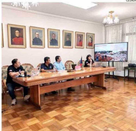
HUBO UNA REUNIÓN PARA DEFINIR CÓMO ABORDAR LAS EMERGENCIAS.

la vida útil del vertedero de Curaco, que es la única alternativa autorizada en la provincia para recibir los desechos domiciliarios de las 7 comunas.