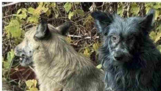
Se estima que más de 700 perros y 100 gatos viven en la zona de exclusión.

Las consecuencias sanitarias se reflejaron en hospitales y centros médicos de Ucrania y Bielorrusia. AP documentó casos de cáncer de tiroides, leucemias y otras enfermedades asociadas a la radiación. El primer balance oficial informó de 30 víctimas mortales inmediatas, entre trabajadores y bomberos, pero los efectos a largo plazo se cuentan por miles de fallecimientos y enfermedades. El fotógrafo Lukatsky describió escenas en salas de oncología pediátrica y salas de emergencia donde los médicos atendían a pacientes con síntomas vinculados a la exposición radiactiva.