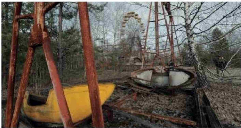
El desastre en la central nuclear de Chernóbil, en Ucrania, fue producto de un diseño defectuoso del reactor soviético, sumado a graves errores cometidos por los operadores de la planta.

De acuerdo con el reporte de la agencia de noticias, la información sobre el alcance real del desastre permaneció bajo control estatal durante años. Los reporteros gráficos y periodistas requerían entregar sus materiales tras cada visita, y los relatos personales solo empezaron a trascender el silencio oficial con el tiempo. Las primeras protestas públicas surgieron en Kiev alrededor del tercer aniversario del accidente, exigiendo transparencia y responsabilidades. Estas manifestaciones contribuyeron