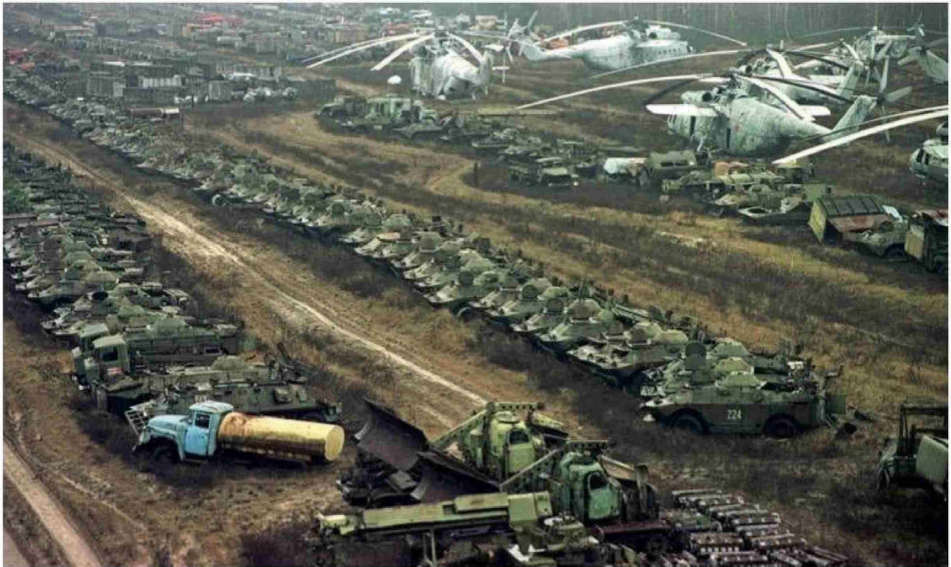
Bosques y fauna reaparecen sobre ruinas humanas. Mientras tanto, quienes vivieron la evacuación siguen arrastrando el dolor del desarraigo.