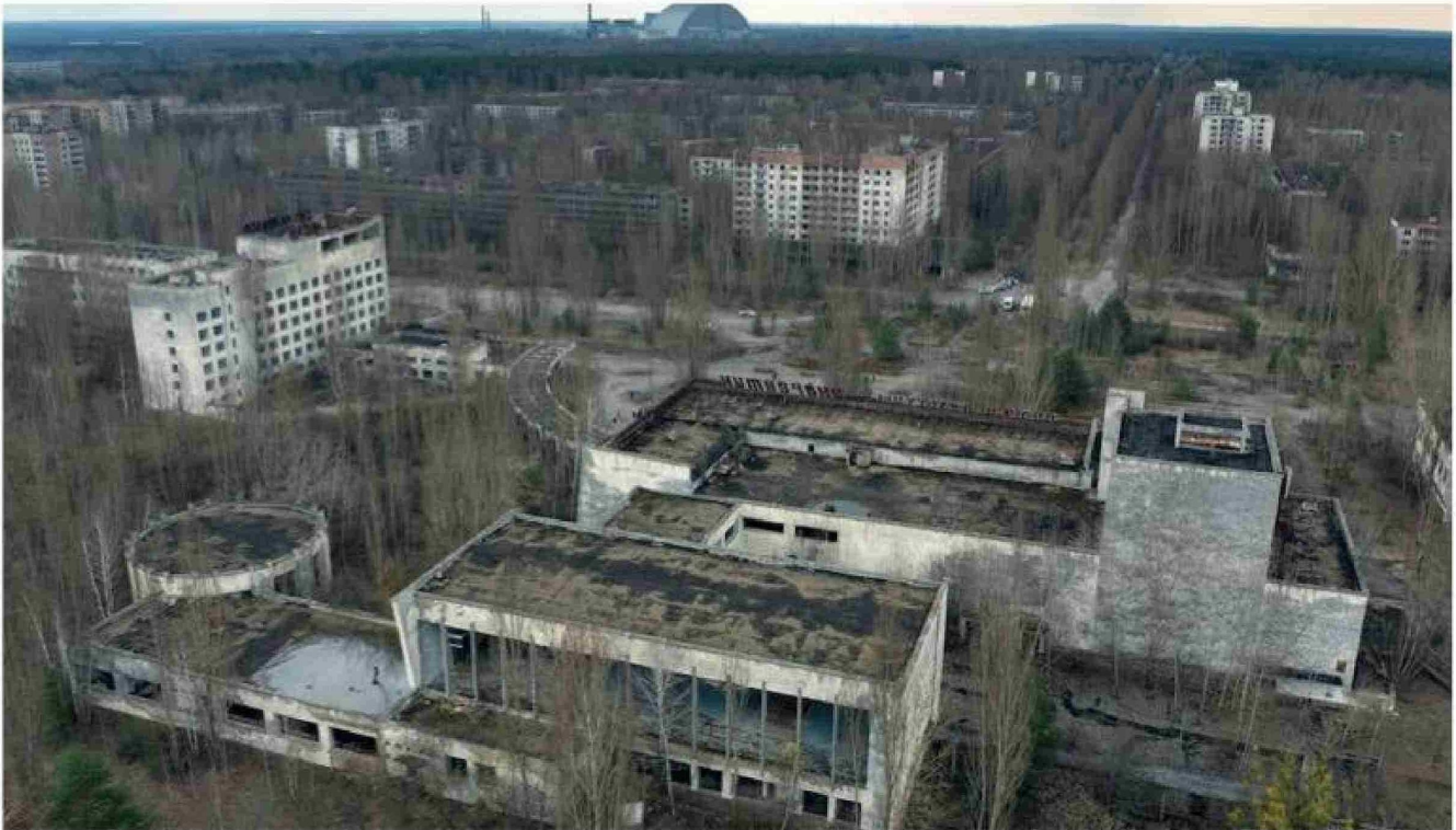
El aniversario número cuarenta del accidente nuclear invita a explorar las huellas en la sociedad ucraniana, los desafíos sanitarios aún latentes.

Tiraje: 5.200 Lectoría: 15.600 Favorabilidad: No Definida