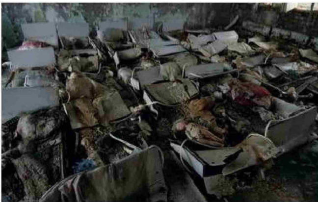
Testimonios inéditos muestran cómo la falta de información oficial profundizó el drama tras la explosión.

efectos de la radiación se hicieron evidentes. Lukatsky relató que revisó su apartamento y su ropa con un medidor de radiación militar y las cifras resultaron alarmantes. Muchos residentes de Kiev y otras zonas recibieron advertencias de amigos y familiares, pero optaron por quedarse junto a sus seres queridos. Asso-