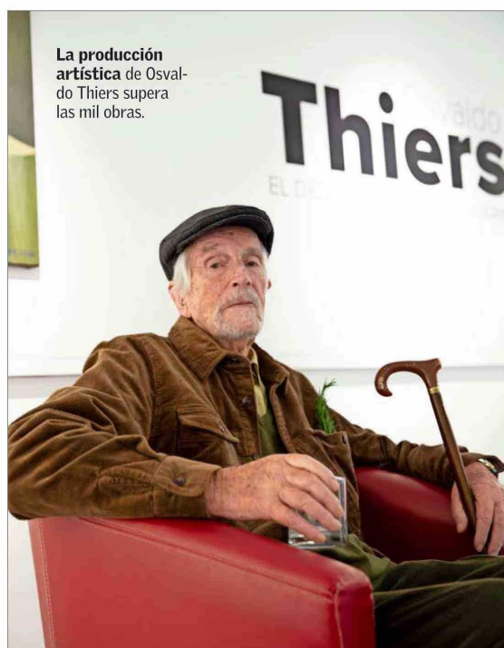
La producción artística de Osvaldo Thiers supera las mil obras.

Lo pictórico remece la Décima Región del país, sobre todo con el recorrido que expone la Casa del Arte Diego Rivera por el universo visual del pintor y escultor Osvaldo Thiers.