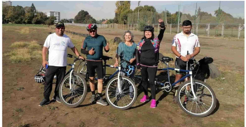
LA ACTIVIDAD PERMITIRÁ que personas ciegas o con visión reducida puedan realizar deporte.