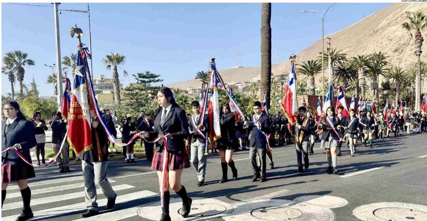
2.600 ESTUDIANTES FUERON LOS QUE LA MAÑANA DEL VIERNES 16, LE RINDIERON HONORES AL ANIVERSARIO 146 DEL COMBATE NAVAL DE IQUIQUE Y LA BATALLA DE PUNTA GRUESA.

Tiraje: 7.300 Lectoría: 21.900 Favorabilidad: No Definida