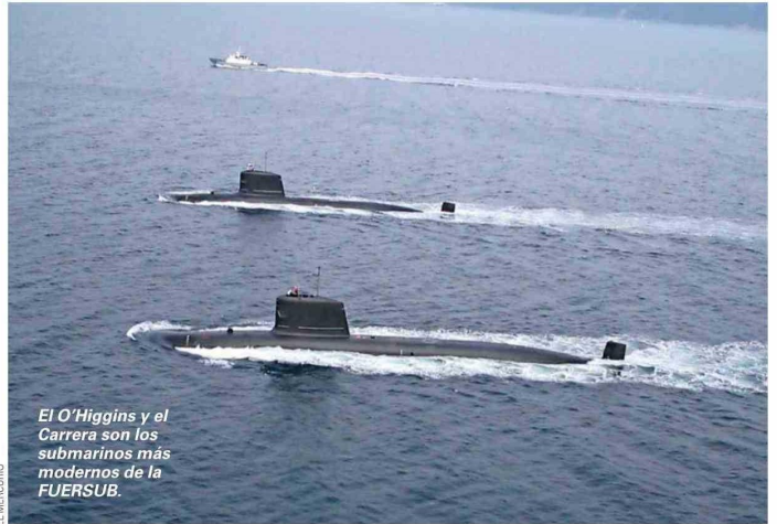
El O'Higgins y el Carrera son los submarinos más modernos de la FUERSUB.

Considerando el prolongado tiempo de operación de los submarinos "Thomson" y "Simpson", con más de cuatro décadas al servicio del país, resulta necesario proyectar oportunamente su renovación. Ello permitirá a Chile mantener las capacidades estratégicas