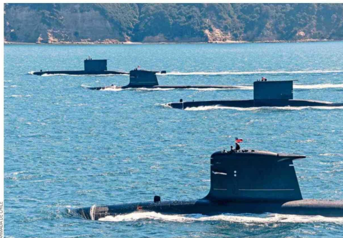
Una adecuada, moderna y entrenada fuerza de submarinos resulta fundamental para mantener las capacidades disuasivas del país.

Los submarinos SS-20 "Thomson" y SS-21 "Simpson" llevan más de 40 años de servicio a la patria, por lo que en un futuro debieran ser renovados por unidades modernas que permitan al Estado mantener la capacidad estratégica particular que ellas proveen.