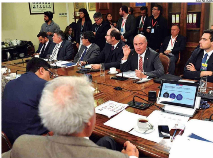
EL MINISTRO QUIROZ DEBERÁ ENFRENTAR MÚLTIPLES CRÍTICAS AL PROYECTO DE LEY.

Asimismo, el debate entre los parlamentarios destaca la tensión entre la urgencia de fomentar el crecimiento económico y la necesidad de mantener el financiamiento de políti-