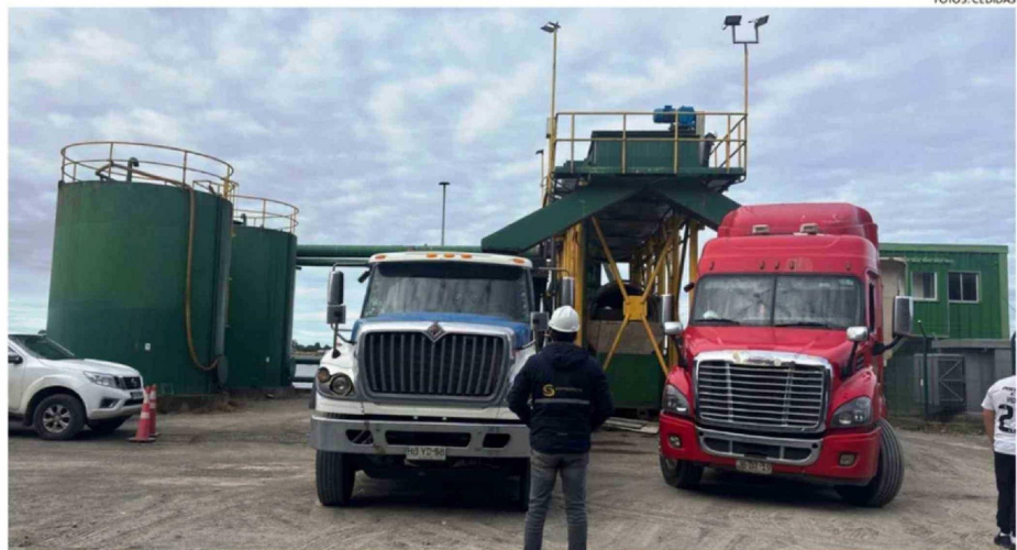
LOS EJEMPLARES MUERTOS DE SALMÓN SALAR O DEL ATLÁNTICO FUERON LLEVADOS A UNA PLANTA REDUCTORA.

La causa preliminar del evento fue asociada a bajos niveles de oxígeno en el agua, descartándose la presencia de floraciones algales nocivas en el área donde se ubica el centro de cultivo, en el mar interior de Chiloé. ☺