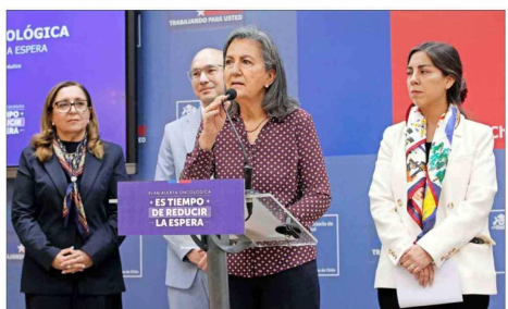
MEDIDA — La alerta oncológica, vigente desde mediados de abril, será uno de los puntos clave en el discurso del mandatario. Se busca acelerar la atención retrasada de más de 33 mil pacientes.

anunciado en primera instancia, si equivale a más de $417 mil millones, un 2,5%. Por lo mismo, una de las preocupaciones es la situación presu-