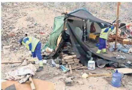
PERSONAL DE LA DIRECCIÓN DE OPERACIONES DESMONTANDO UN RUCO.