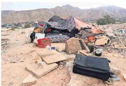
ADEMÁS DE LA BASURA DEBIERON RETIRAR UNOS RUCOS, SIETE EN TOTAL.