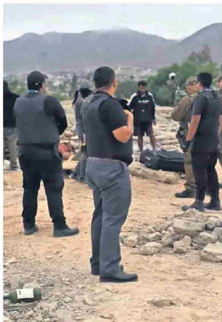
LAS PERSONAS EN SITUACIÓN DE CALLE DEBERÁN BUSCAR OTRO SITIO.