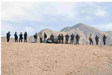
LA IDEA DEL OPERATIVO CONJUNTO ES RECUPERAR LOS ESPACIOS PÚBLICOS.