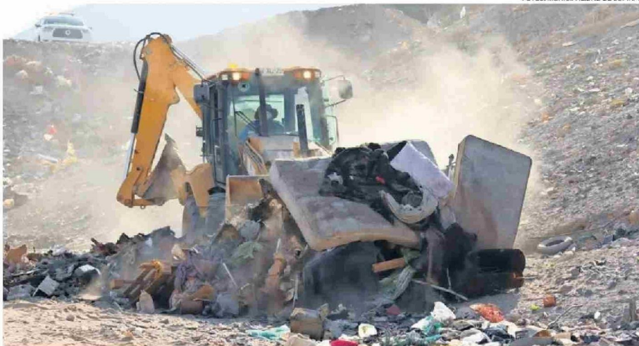
CON MAQUINARIA DEBIERON RETIRAR KILOS Y KILOS DE ESCOMBROS, PUES EL EX COMPLEJO PEDRO LEÓN GALLO SE TRANSFORMÓ EN UN MICROBASURAL.