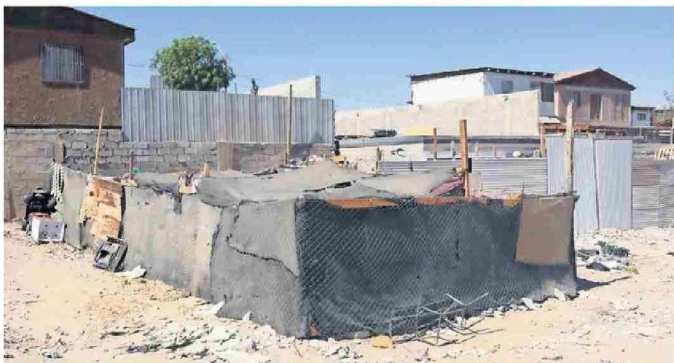
ALGUNOS RUCOS CONTABAN CON MATERIAL LIGERO PARA SU CONSTRUCCIÓN, ESTE FUJE DEMOLIDO CON MÁQUINA.