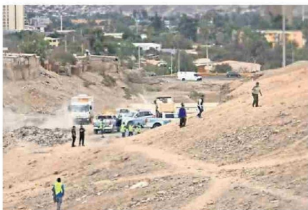
DOS DIRECCIONES DEL MUNICIPIO Y CARABINEROS HICIERON EL OPERATIVO.