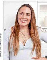
La atleta Natalia Duco se perfila como ministra de Deportes.