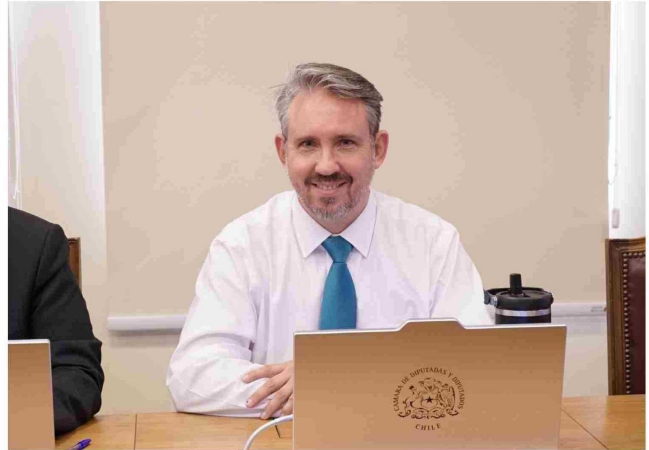
"Hoy, el organismo de control nos da la razón: hubo una falta de concursabilidad inaceptable y se evitó la licitación pública sin razones que lo justificaran", dijo el diputado.

El "Programa para Pequeñas Localidades" corresponde a una iniciativa del Ministerio de Vivienda y Urbanismo orientada a