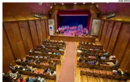
EL 30 Y EL 31 DE MAYO HABRÁ VISITAS GUIADAS AL TEATRO GALIA.

La sugerencia es que puedan cederlas para que sean escaneadas y devueltas. Con ello se creará un archivo digital con dichos registros. Los interesados en colaborar pueden escribir al correo electrónico archivos@lsmb.cl .