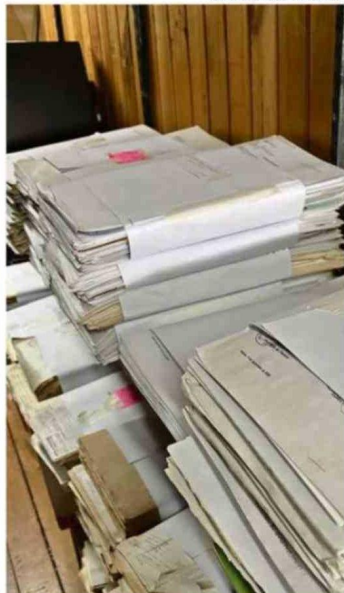
EL ARCHIVO PARTICIPARÁ POR PRIMERA VEZ EN LA CELEBRACIÓN DEL DÍA DEL PATRIMONIO.