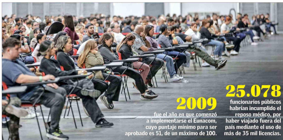
PRUEBA REQUISITO. — El Eunacom tiene componentes teóricos y prácticos y se aplica a todos los médicos que deseen ejercer en el sistema público de salud.