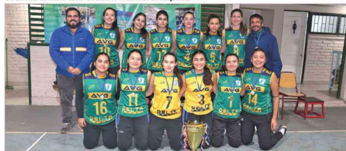
Fondos Concursables MVC - Premiación Campeonato de Voleibol Requínoa.

de yoga para adultos mayores, proyectos de medicina alternativa comunitaria para jefas de Hogar o implementar Talleres de Compostaje en colegios, entre muchos otros, los programas de liderazgo local, envejecimiento activo, vida saludable y formación de competencias que seguiremos impulsando este año nacen desde la co-construcción y el desarrollo comunitario. Otro compromiso dentro de nuestro plan de relacionamiento es con las empresas colaboradoras (EECC.) de MVC, fundamentales en el día a día de nuestra operación. Porque si a ellas les va bien, a nosotros también. Por eso privilegiamos perma-