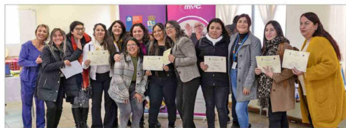
Ceremonia de cierre Taller de Huerto Medicinal en Requínoa.

• El desarrollo territorial , contribuyendo a mejorar sus indicadores de desarrollo, como educación, bienestar social, conciencia ambiental y la construcción de capacidad comunitaria e infraestructura. Como parte de ese relacionamiento fomentamos un diálogo abierto, participativo y transparente, desarrollando en conjunto proyectos sostenibles que generen un valor compartido en tres áreas de trabajo preponderantes: sustentabilidad y medio ambiente; protección a los adultos mayores y niños, y capacitación, desarrollo y educación. Ya sea que se trate de taller