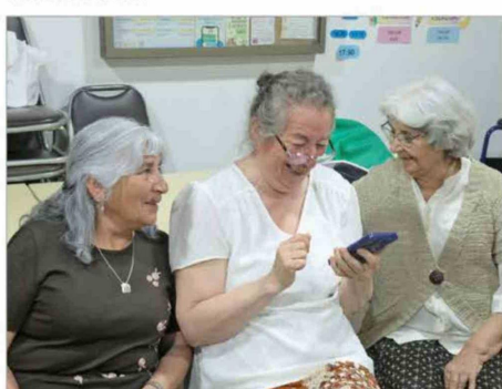
Taller de Alfabetización Digital en Cediám Olivar-Gultro.

Uno de los ejes del modelo de economía circular de Minera Valle Central (MVC) es nuestro plan de relacionamiento comunitario, cuyo objetivo es ser un "buen vecino" de las comunidades de Requínoa y Olivar, cercanas a nuestra operación, a través de un trabajo colaborativo cuyo fin es mejorar la calidad de vida de sus habitantes mediante un desarrollo sostenible.