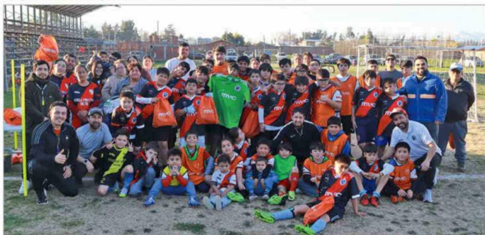
Apoio al desarrollo deportivo en Escuela Formativa de Fútbol Gultro.