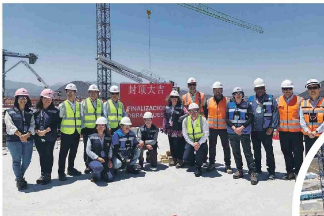
El nuevo hospital lleva un 25% de avance y será cuatro veces más grande que el actual recinto porteño. Su entrega se estima para febrero de 2028.