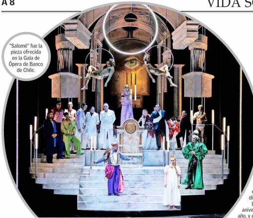
"Salomé" fue la pieza ofrecida en la Gala de Ópera de Banco de Chile.