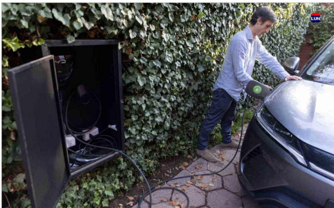
El inversor del sistema tiene identificado el cargador del auto y detecta cuando se conecta.

"Cargo el auto un día y me sirve para prácticamente toda la semana. Hoy la totalidad de la carga proviene de la energía generada por los paneles solares. En la práctica, ahorro en electricidad y también en combustible, pero lo más cómodo ha sido integrar el auto eléctrico al sistema solar. Hoy, con un buen día de sol puedo