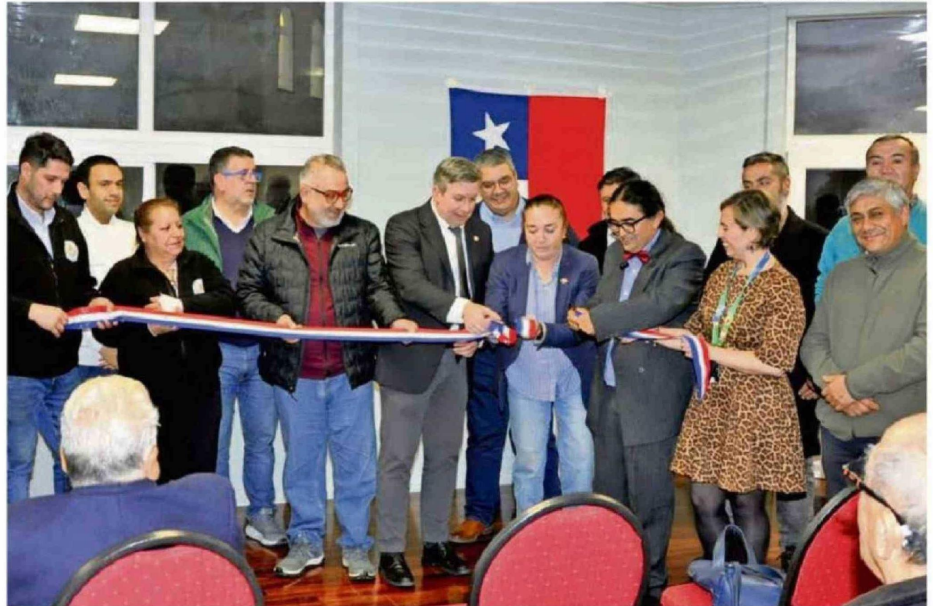
AUTORIDADES Y REPRESENTANTES DE SERVICIOS ACOMPAÑARON A LOS DIRIGENTES DE LA CÁMARA EN LA INAUGURACIÓN DEL TERCER PISO.