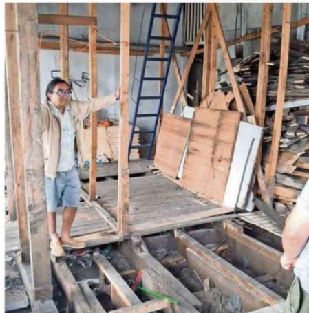
ANTES Y DESPUÉS DEL RECINTO, AFECTADO POR UN INCENDIO EN 2014 Y REFACCIONADO PAULATINAMENTE DESDE ENTONCES, POR LA CÁMARA