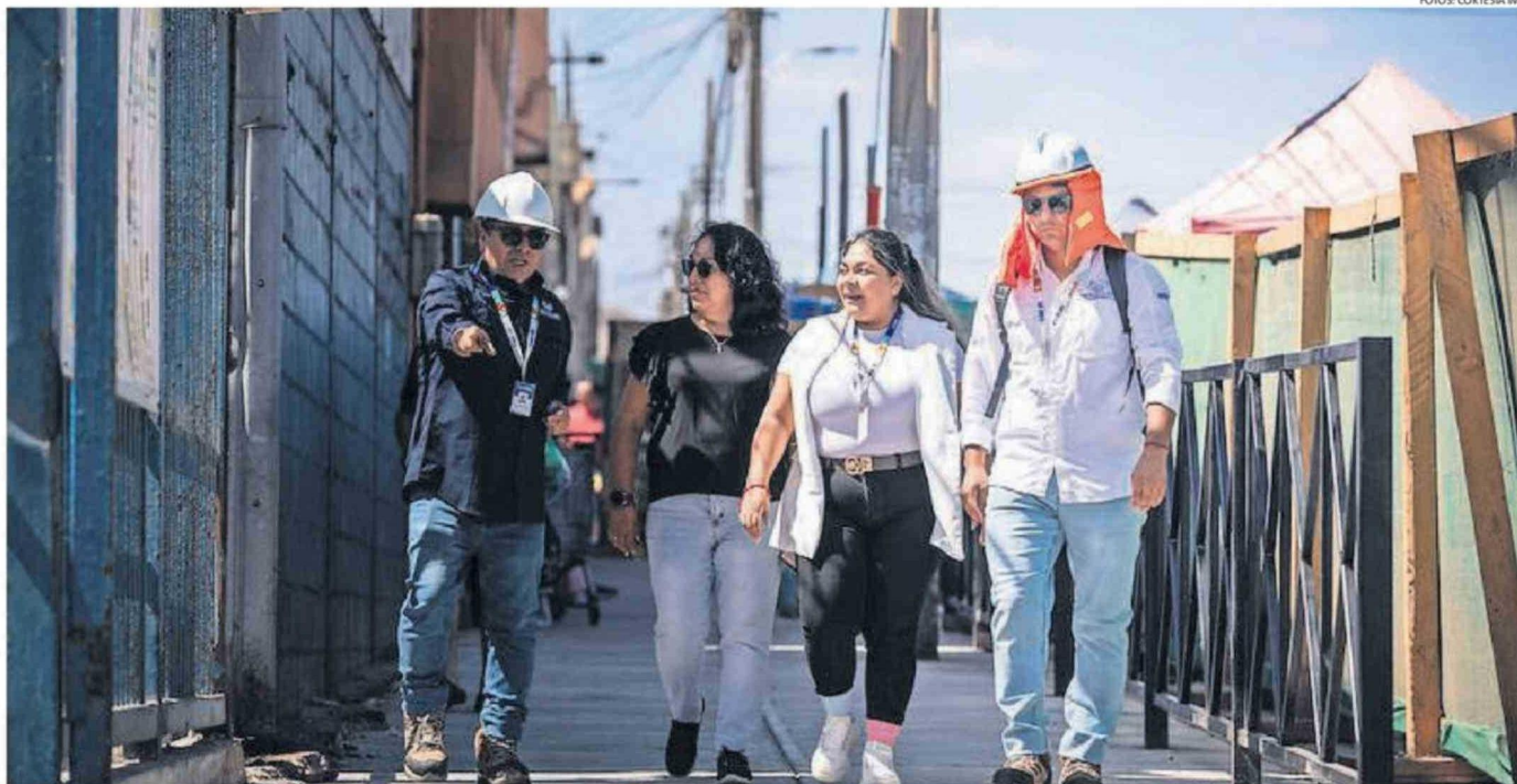
FUNCIONARIOS MUNICIPALES PUDIERON VERIFICAR EL AVANCE EN LA OBRA "MEJORAMIENTO DE ESPACIOS PÚBLICOS TERMINAL AGROPECUARIO ARICA", FINANCIADA CON FONDOS SUBDERE.