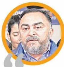
EXPERTA INDICÓ QUE NO EXISTE DESTRUCCIÓN DE EMPLEOS, SINO INCAPACIDAD DE CREARLOS ANTE UNA MAYOR FUERZA LABORAL

Nos preocupa la falta de proyectos que avancen en infraestructura y desarrollo de la industria”.