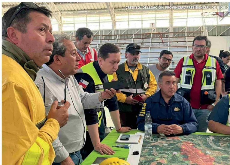
AUTORIDADES SE REUNIERON EN LA COMUNA DE LAJA, donde se realizaron Cogrid a raíz de la emergencia por la que atraviesa la provincia en materia de incendios.

Tiraje: 3.600 Lectoría: 14.800 Favorabilidad: No Definida