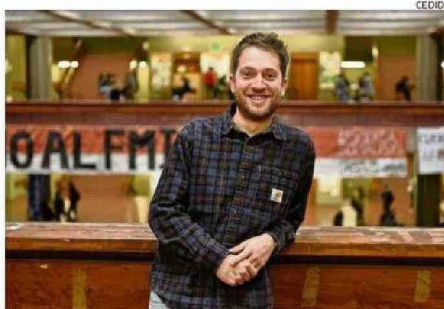
Boscaini es dr. en Ciencias Biológicas y Paleontólogo Naturalista.

“ Ninguna crisis climática previa los afectó de manera tan radical, lo que apunta a la presión antropogénica como la variable nueva y como el golpe final. ”