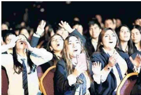
LOS ESTUDIANTES FUERON LOS PROTAGONISTAS DEL EVENTO.