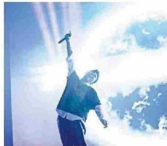
EL FESTIVAL CONTÓ CON LA PRESENTACIÓN DE FLANGR, MÚSICO QUE MEZCLA SONIDOS DEL ESPACIO CON SUS LÍRICAS.