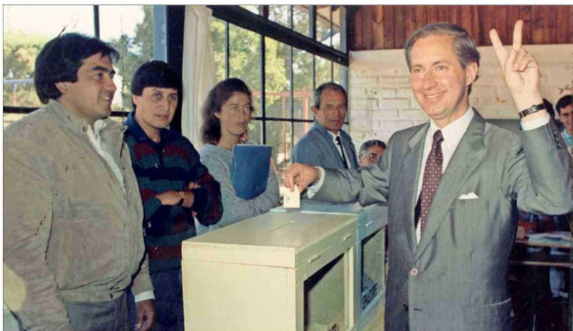
Eliminar la UF fue uno de los compromisos de campaña presidencial de 1989. En la imagen, Errázuriz votando en una jornada electoral que lo dejaría en tercer lugar tras Aylwin y Büchi.

Errázuriz conta que sus comienzos en los negocios fueron con la venta de huevos y pollos, además de la crianza de abejas y venta de miel. El empresario también protagonizó negocios relevantes y hechos polémicos en su actividad