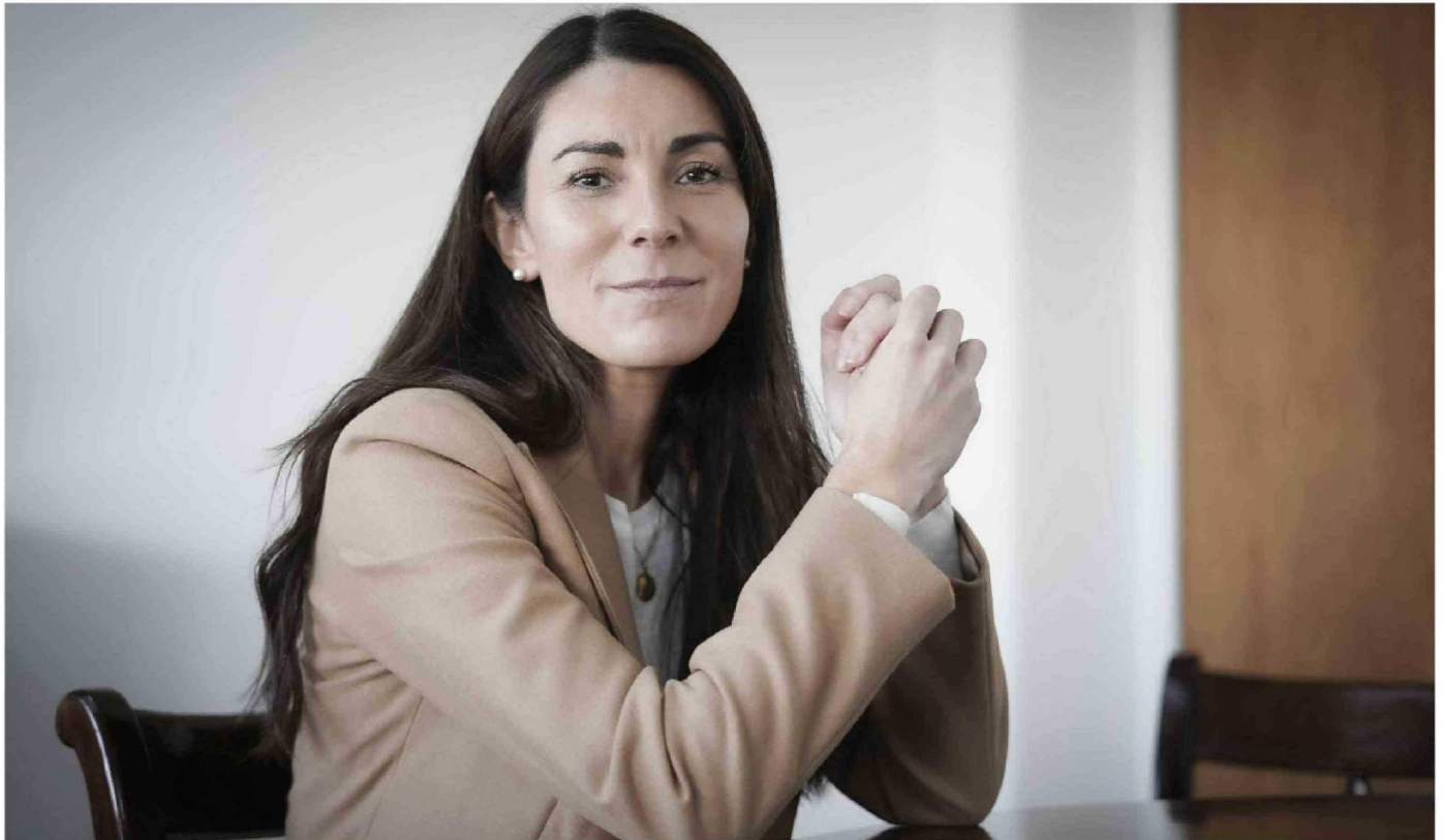
► La ministra de Educación, María Paz Arzola, defiende el proyecto de Escuelas Protegidas en los colegios.

Tiraje: 78.224 Lectoría: 253.149 Favorabilidad: No Definida