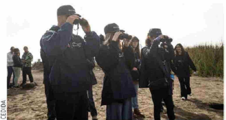
En La Serena, y en los otros dos puntos, los asistentes participaron de talleres de avistamiento de aves, guiados por especialistas locales.

clave para promover cambios de conducta sostenibles en el tiempo. Durante la actividad los voluntarios y sus familiares participaron en talleres de reforestación con especies nativas, de conciencia ambiental, de flora y fauna y avistamiento de aves, entre otras actividades, guiadas por especialistas y organizaciones colaboradoras locales.