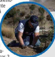
En la ribera del estero El Sauce, en San José de Maipo, se realizaron trabajos de reforestación.