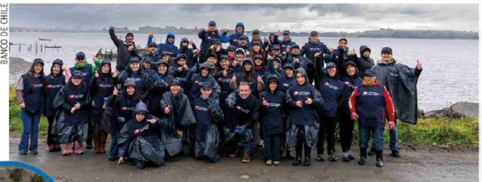
BANCO DE CHILE

Desde su creación, en 2022, la Cuadrilla Azul de Banco de Chile ha centrado sus esfuerzos en la recuperación de espacios naturales afectados por la contaminación. Este año, la iniciativa dio un paso adicional, fortaleciendo su dimensión educativa como un elemento