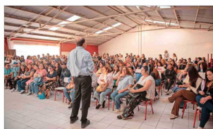
En San Antonio, sostuvo varias reuniones con dirigentes de comités que llevan hasta más de una década ahorrando y postulando por la vía legal.