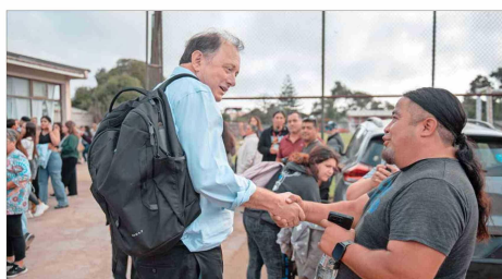
El futuro secretario de Estado ha recorrido los sectores arrasados por el fuego en el Biobío; de Geo Chile, Miramar y Vista Hermosa.

Aunque el fenómeno de la megatoma protagonizado por 4 mil familias centró la atención en la zona de la oficina Atisba del urbanista, es la primera vez que Poduje la visita confirmado en el cargo que asumirá el 11 de marzo.