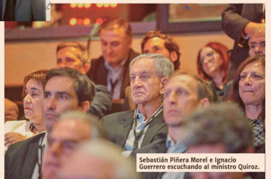
Sebastián Piñera Morel e Ignacio Guerrero escuchando al ministro Quiroz.