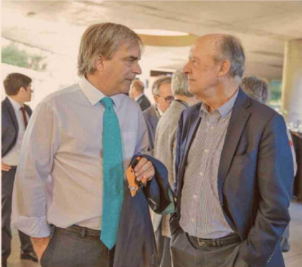
El senador Luciano Cruz-Coke y Cristián Larroulet.