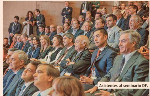
Asistentes al seminario DF.