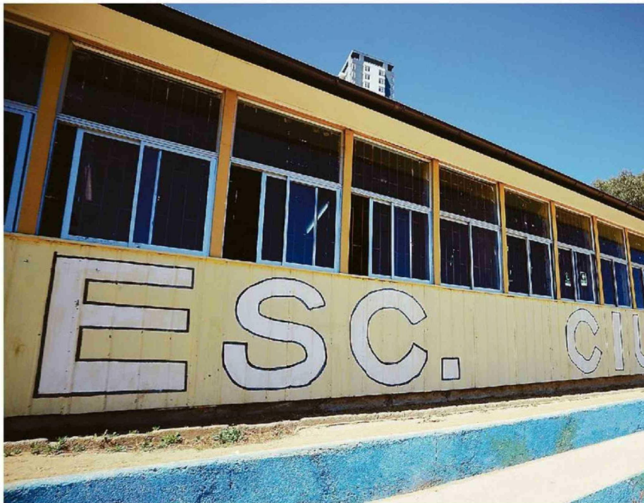
UNO DE LOS PRINCIPALES PROBLEMAS QUE ENFRENTÓ EL SLEP FUE LA PRECARIEDAD EN QUE ESTABAN ALGUNOS ESTABLECIMIENTOS.

propias de un servicio público, y entre dejar de ser un sostenedor. O seguir siendo un sostenedor: ese es el debate. Así tienen mayor flexibilidad y más libertades, pero también así es cómo se generaron problemas tales como endeudamiento innecesario, negociaciones colectivas onerosas e imposibles de cumplir, o todo el tema de la infraestructura y mantenimiento”.