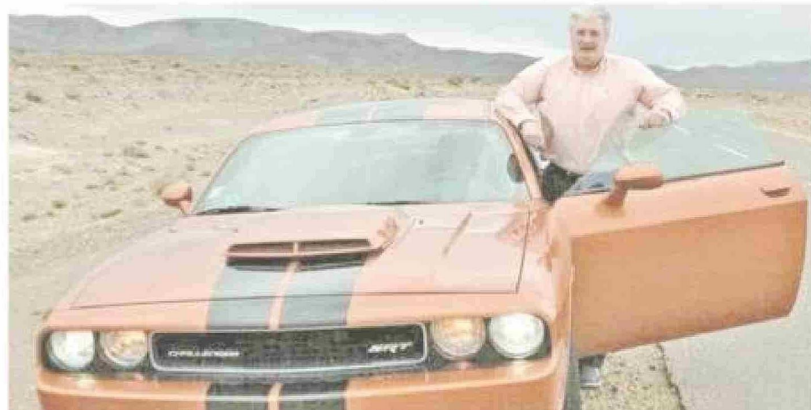
Alejandro Kusanovic con su Dodge Challenger v8 6.4 litros

El senador Alejandro Kusanovic divide sus intereses personales en dos grandes ámbitos: la visión de futuro y la ingeniería aplicada. Dedicar gran parte de su tiempo libre a investigar sobre ciencia y tecnología, lo que le permite según él "proyectar hacia dónde avanza la sociedad".