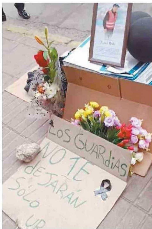
SUS COMPAÑEROS DE TRABAJO Y FAMILIARES SE HAN MANIFESTADO EN EL LUGAR DEL ATROPELLO.

Desde aquella fatídica jornada sus compañeros de trabajo junto a familiares han realizado diversas