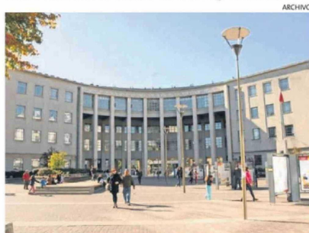
ERROR FUE DETECTADO EN EL 7° JUZGADO CIVIL DE CONCEPCIÓN.