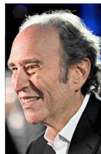
Xavier Niel, controlador de Millicom.