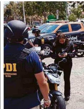
OPERATIVO SE REALIZÓ ESTE MIÉRCOLES

La autoridad fue enfática en señalar que el criterio de selección no será al azar, sino que se priorizará la propuesta que asegure la mejor recuperación de la infraestructura y los tiempos de ejecución más acotados para otorgar la Concesión de uso gratuito. Esta variedad de postulantes tanto públicos como privados abre un abanico real para que el edificio deje de ser un foco de peligro y vuelva a servir a la comunidad de Forestal.