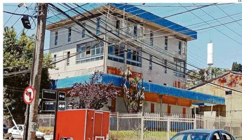
EL EXCUARTEL DE LA PDI SUFRIÓ DAÑOS TRAS EL TERREMOTO DE 2010.

"El lugar está insalubre, sucio, con pastizales y es un peligro de incendio. No han venido a hacer limpie-