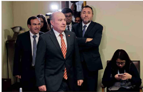
El ministro de Hacienda, Jorge Quiroz, junto a la Dipres, expuso ayer los cálculos del informe financiero.