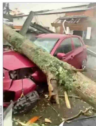
DESTRUCCIÓN. — No se reportaron daños a infraestructura crítica, pero muchos postes cayeron y gran parte del centro estaba sin alumbrado público o domiciliario.

Moncada explica que al analizar imágenes de voladuras de techo, derrumbes de árboles e incluso desplazamiento de vehículos por los vientos, puede ser clasificado como "F1".