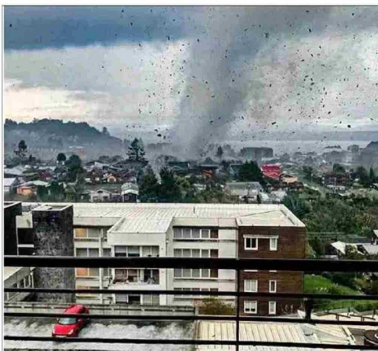
PRONÓSTICO. — Una alerta por vientos estaba vigente en la zona, pero no por tornados, que no son frecuentes en la región. Las viviendas perdieron parte o toda su techumbre.

La Dirección Meteorológica mantenía anoche alarmas por el eventual desarrollo de fenómenos similares entre las regiones de Biobío y Los Lagos.