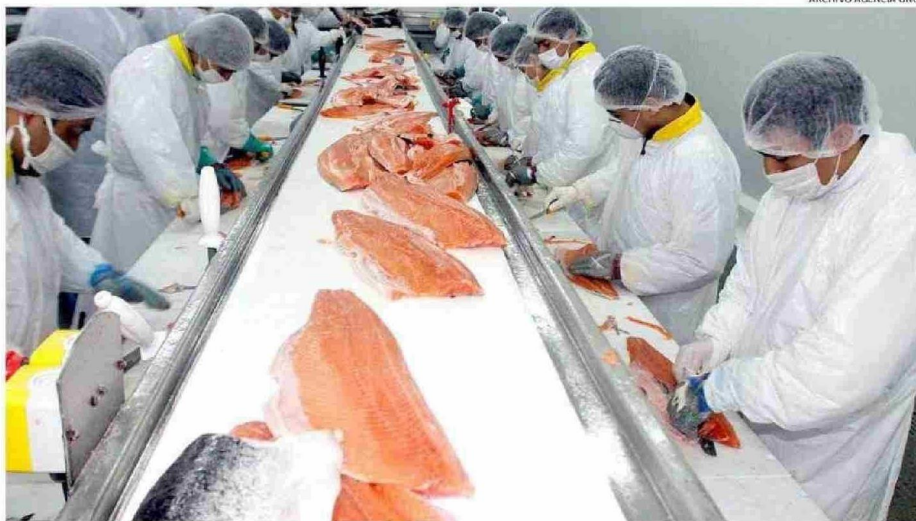
EL 94% DE LOS ENVÍOS A ESTADOS UNIDOS CORRESPONDE A SALMÓN FRESCO TRANSPORTADO POR VÍA AÉREA. ESTAS EXPORTACIONES ALCANZARON UN VALOR CIF DE US$4.125 MILLONES.

Al secretario de Estado se le expuso asimismo poder abordar ciertas trabas regulatorias y la