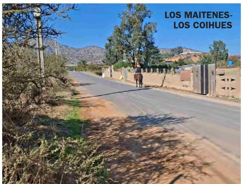
LOS MAITENES- LOS COIHUES