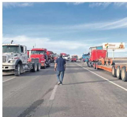
EN CALAMA TAMBIÉN HUBO CORTES PARCIALES DE LAS RUTAS.

En paralelo y mientras continuaban las negociaciones en gran parte del territorio nacional, durante la tarde la ministra del Interior Izkia