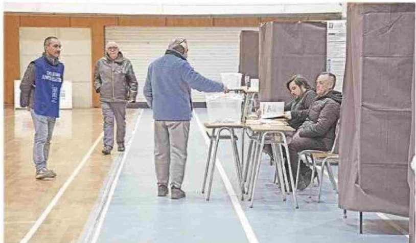
Una baja participación se observó en las primarias de este domingo. La foto fue captada a las 14 horas en el gimnasio Fiscal.