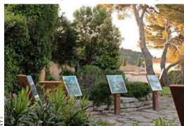
JARDIN DES PEINTRES. Este lugar está cerca del último estudio del pintor.

Unas pocas cuadras al sureste de la iglesia, el último departamento de Cézanne se encuentra a pasos del recién inaugurado