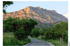
STE.-VICTOIRE. Esta montaña protagoniza muchas obras de Cézanne.

El recién renovado Atelier des Lauves justifica caminar 20 minutos cuesta arriba, desde el pueblo, por la avenida que ahora lleva el nombre del artista. Cézanne cons-