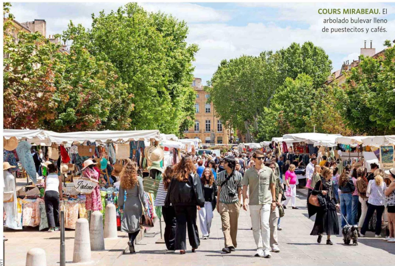
COURS MIRABEAU. El arbolado bulevar lleno de puestecitos y cafés.