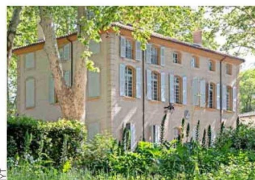
JAS DE BOUFFAN. En esta propiedad, el pintor trabajó más de 40 años.

En el sur de Francia, esta ciudad de ensueño tuvo una relación compleja con el —hoy— reconocido pintor mientras este vivió. Desde fines de este mes y hasta el 2026, cuando se cumplan 120 años de su muerte, habrá mil panoramas para redescubrir sus calles y edificios, y el amor que muestran por su hijo más famoso. POR Alexis Steinman.