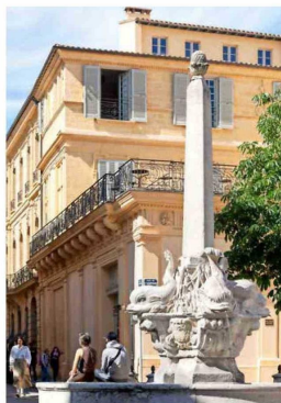
MAZARIN. Es uno de los distritos emblemáticos de la ciudad.

El cercano Barrio Mazarino era un bastión burgués en el siglo XVII. Las piedras color miel de susuntuosas mansio-