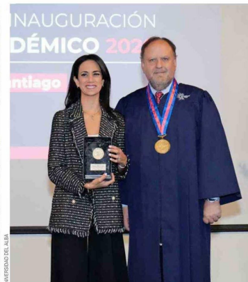
UNIVERSIDAD DEL ALBA